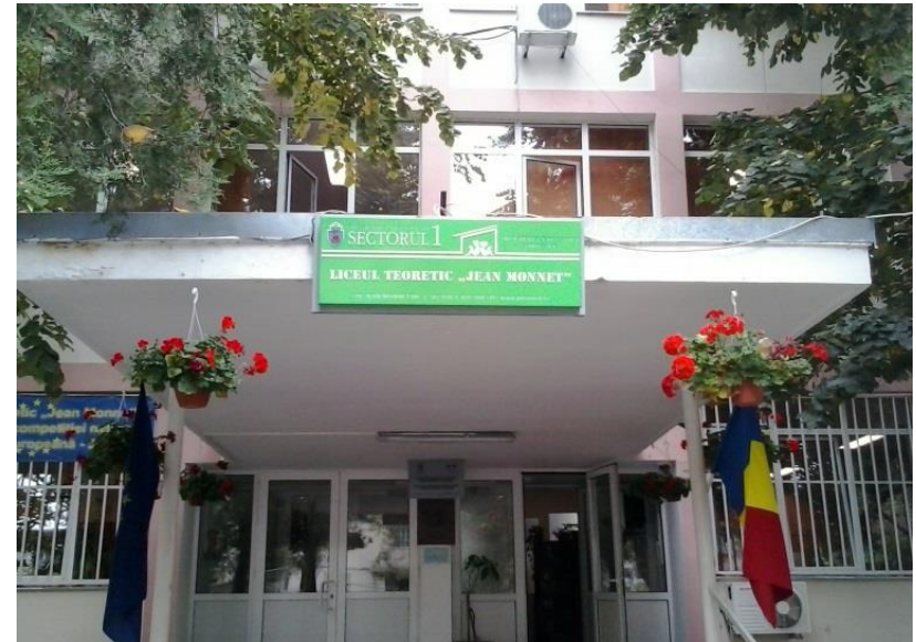
LICEUL TEORETIC "JEAN MONNET"