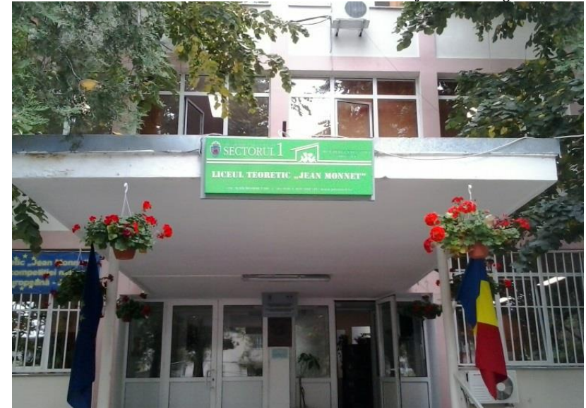
LICEUL TEORETIC "JEAN MONNET"