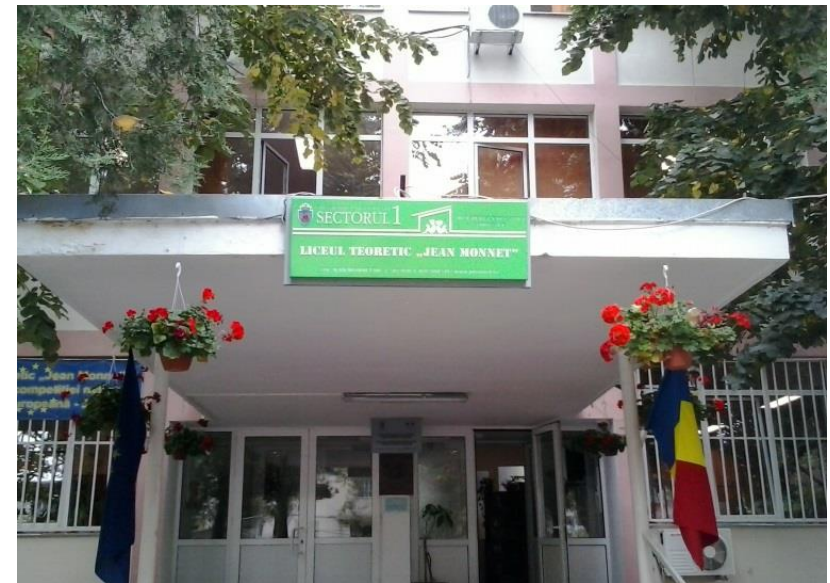
LICEUL TEORETIC "JEAN MONNET"